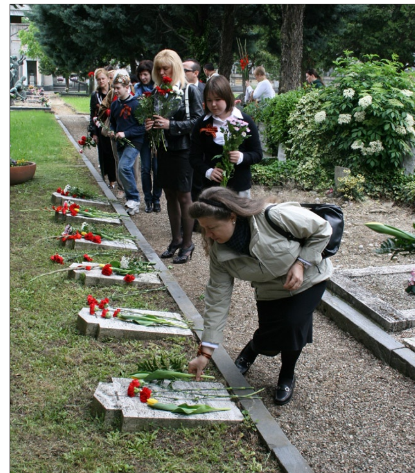
Церемония возложения венков к памятникам советским и итальянским партизанам, погибшим в годы Соппротивления и захороненным в Милане. 9 мая 2010

Среди некоторых последних новых проектов хотел бы выделить соглашение между ОАО «Соллерс» и концерном «Фиат» о создании совместного предприятия по разработке и производству автомобилей на базе завода, строящегося в городе Елабуга, подписанное 11 февраля 2010 года. Планируется, что в случае максимальной загрузки предприятие будет выпускать до 500 тысяч автомобилей. Наряду с производством легковых автомобилей на совместном