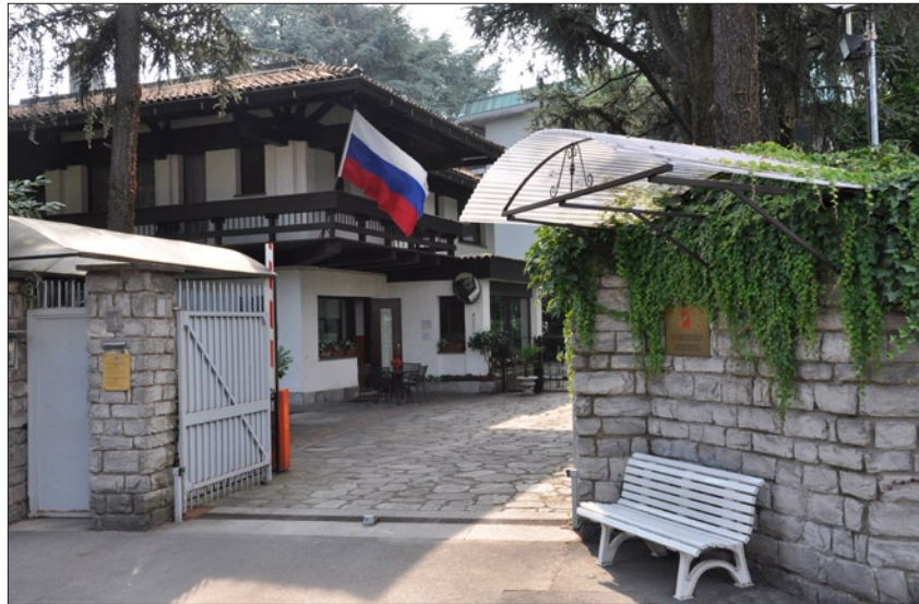
Здание Генерального консульства России в Милане

подготовка очередной Венецианской биеннале, которая пройдет летом 2011 года, где российская экспозиция должна стать одной из наиболее интересных и представительных.