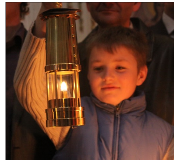
Пасхальное богослужение с благодатным огнем, доставленным при содействии Генерального консульства России в Милане в приход Святителя Амвросия Медиоланского и приход Святых Сергия Радонежского, Серафима Саровского и Викентия Сарраговского Русской православной церкви. 4 апреля 2010

Очень полезным нововведением стал также перевод Генконсульства с 1 октября 2009 года на новую систему приема посетителей — предварительную электронную запись через систему RusTurn, доступную с любого подключенного к Интернету компьютера. Итоги первого года работы по данной системе убедительно свидетельствуют о том, что она существенно изменила в лучшую сторону ситуацию с приемом посетителей: исчезли длинные очереди у ворот Генконсульства, а вместе с ними проблемы напряженной психологической обстановки ожидания, недопонимания и конфликтов. Отныне посетители гарантированно попадают на прием в Генкон-